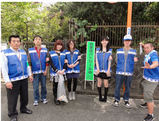
学校周辺の住宅街見回り

防犯ボランティアという分野における若い世代の活動人口は極めて少なく、全国的にその必要性が叫ばれています。MCATはそんな防犯ボランティアという分野において、若い世代の先駆けのような存在になれたらと思っています。