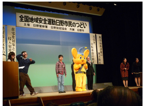
日野市市民のつどいでの防犯寸劇