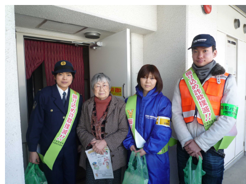
一人暮らしの老人宅訪問 (振り込め詐欺防止呼びかけ)