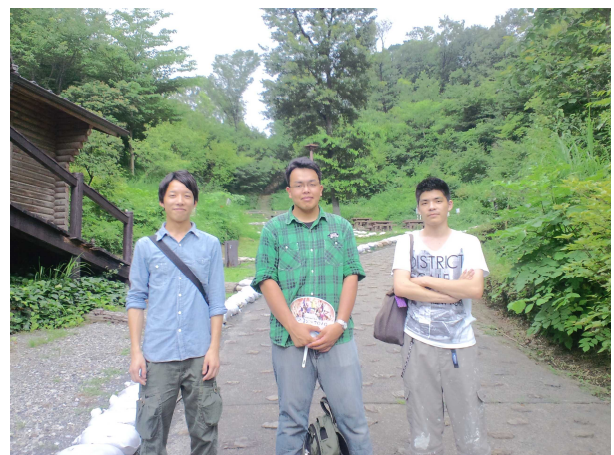
日野市雑木林ボランティア講座受講(日野市南平丘陵公園にて)