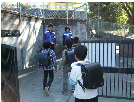
夢ヶ丘小学校の下校サポート