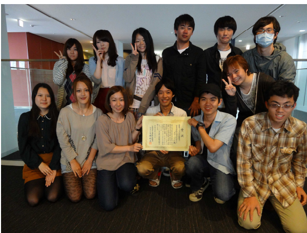
東京都公園協会賞奨励賞(ボランティア活動部門)受賞!

今後の活動予定としては、月1回東光寺緑地で活動したり、12月15日～17日には東京ビックサイトで開催する日本最大の環境イベント「エコプロダクツ展」に出展したりして活動報告を行います。